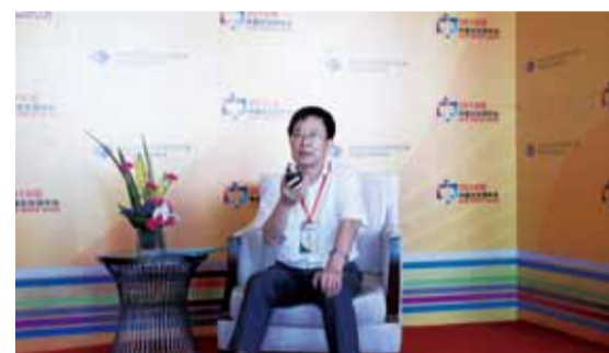
图文化部国家公共文化服务体系专家委员会主任李国新在谈论文化馆转型升级的问题

林岳豹:我们的乡村春晚是围绕“看得见山、挖得见水、记得起乡土”这一种模式。浙江青田是一个侨乡,70%以上是侨民,很多侨民过年是回不了祖国大陆的,但他们过年的时候也想有一个情感寄托体,所以我们就将青田县的乡村春晚进行定制,利用互联网的模式,将当地办春晚与国外参与春晚紧密结合起来,其实我们山口村春晚上线的时候,国外有时差,但这也把所有的侨胞集合在一起,通过互联网收看春晚,第一个节目就是侨胞拜年,场面非常感人,山口村春晚准备的又都是些非遗、极具地方特色的节目,这台春晚想满足的就是侨胞们期盼的乡愁与年味。